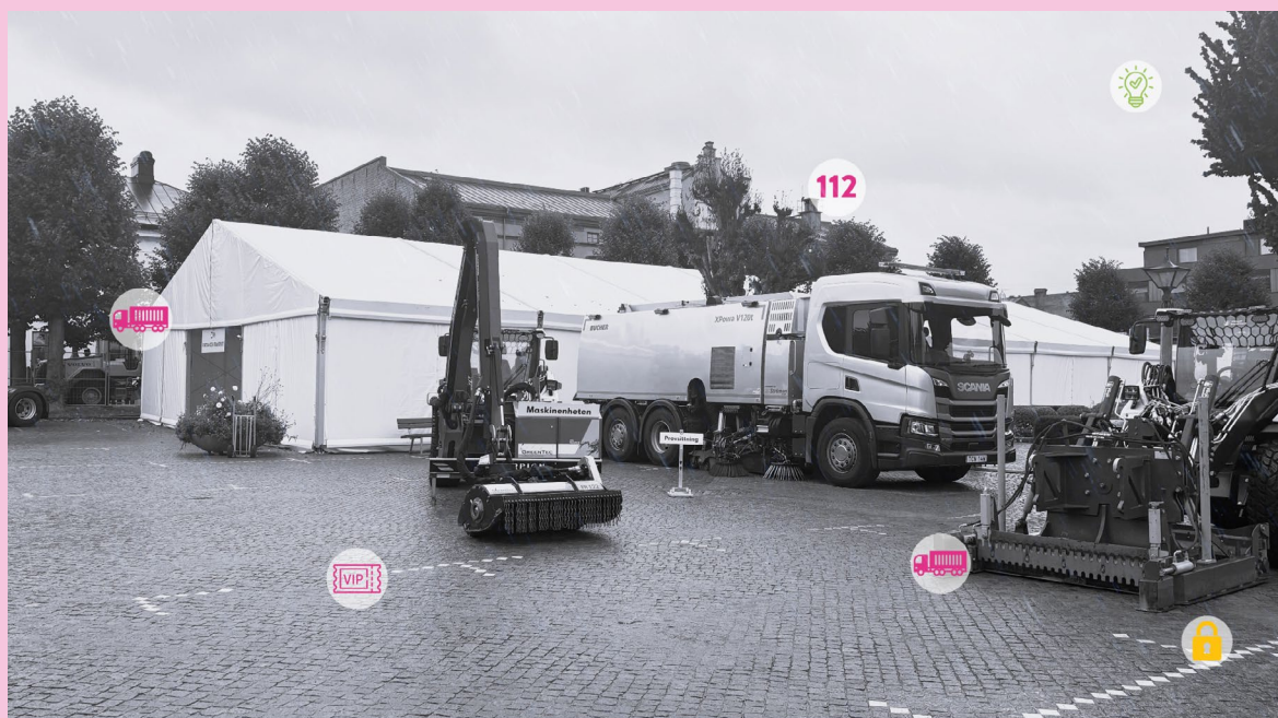
Bilden är från Yrkesdagens Escape room 2025.